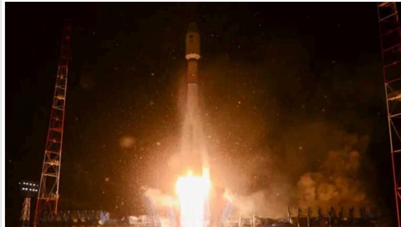
The Telegraph: Росія розмістила на орбіті супутники-вбивці та може атакувати "зовсім з іншого напрямку"

Країна-агресор Росія 16 травня 2024 року запустила супутник, який, ймовірно, є зброєю, здатною не лише проводити огляд, а й атакувати інші супутники у космосі. Йдеться про супутник під назвою "Космос 2576".