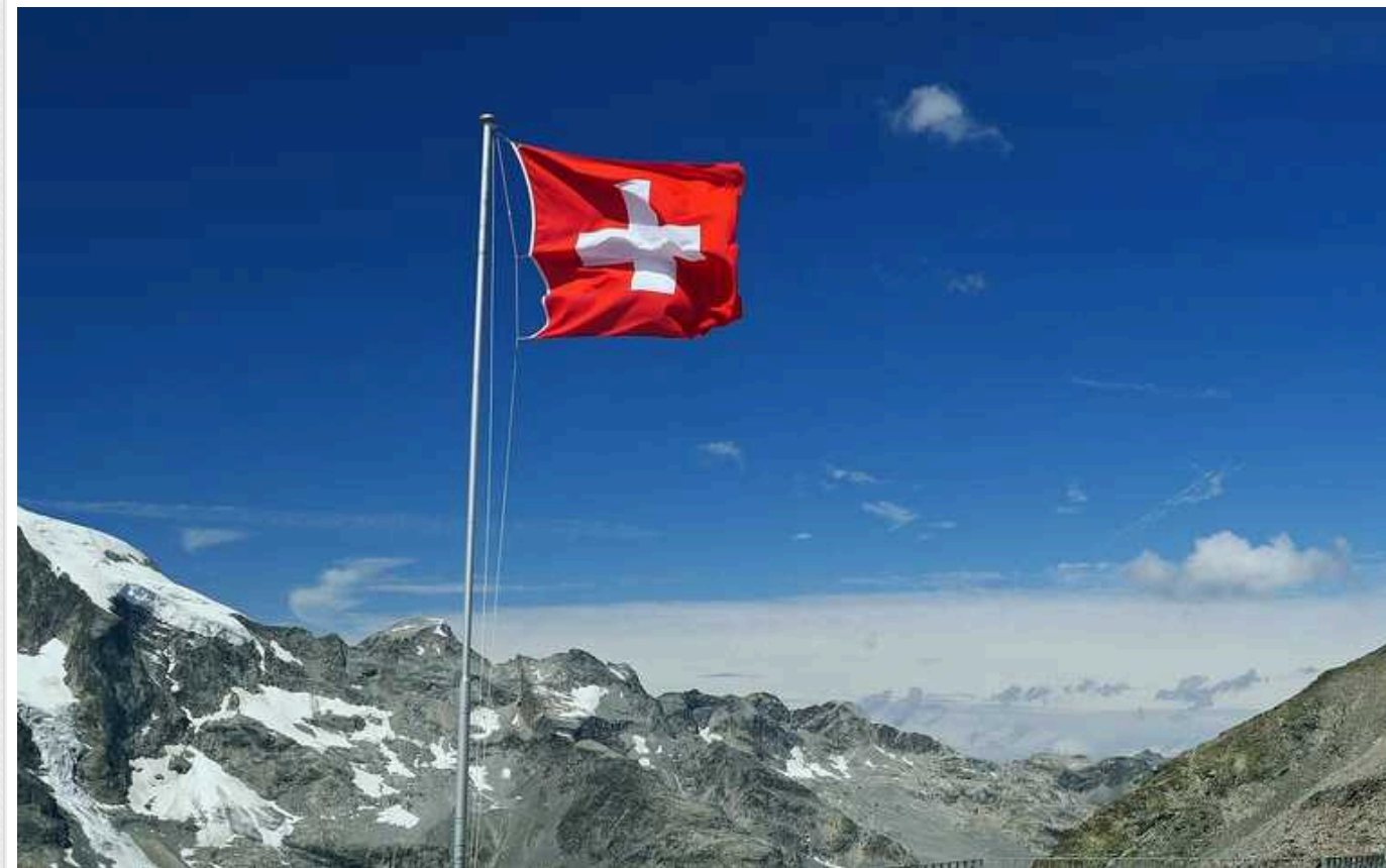
Швейцарія підтримує план Байдена щодо припинення війни у Газі

Швейцарія підтримує нову мирну пропозицію, висунуту президентом США Джо Байденом, угоду про заручників та припинення вогню в Секторі Гази.