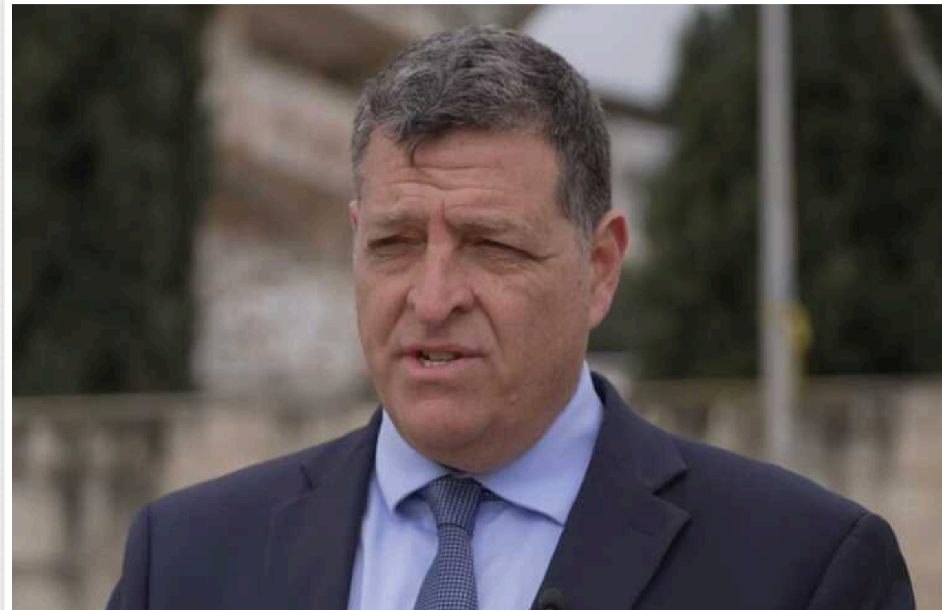
В Ізраїлі прийняли план Байдена щодо врегулювання в Секторі Гази, - ЗМІ