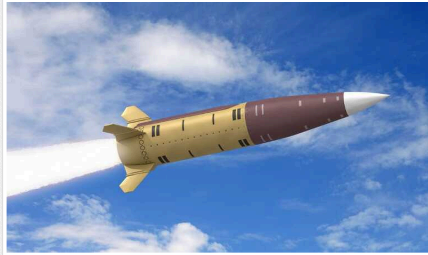
Президент Зеленський вважає, що Сполучені Штати мають дозволити бити по РФ ракетами ATACMS

Президент Володимир Зеленський вважає, що Сполучені Штати мають дозволити Україні уражати військові об'єкти на території Росії далекобійними ракетами ATACMS.