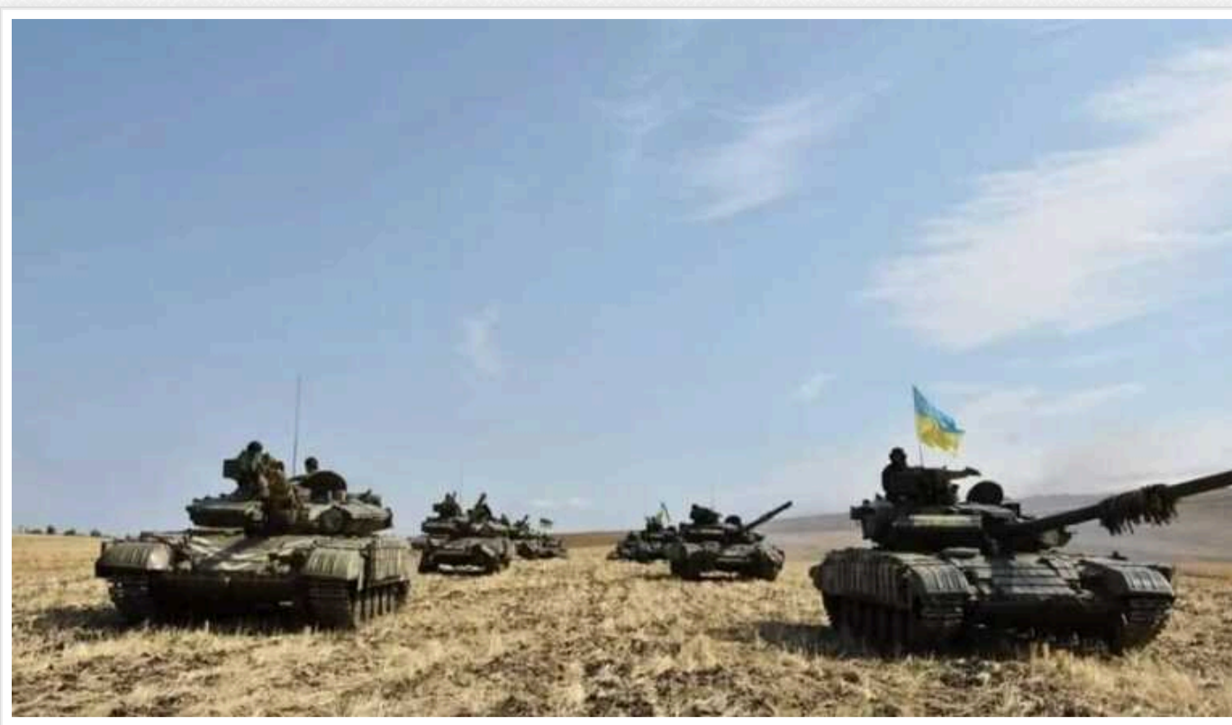
Генштаб ЗСУ: У районі Стариці на Харківщині йде бій, на Покровському напрямку напружена ситуація

На українському фронті напередодні відбулося 98 бойових зіткнень, ще 29 – від початку цієї доби. Напружена ситуація зберігається на Покровському напрямку, де війська РФ намагаються просунутися в кількох точках, гаряче й на півночі Харківщини.