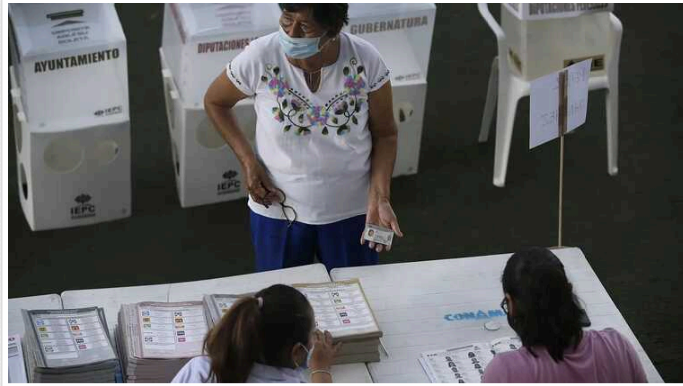
Мексика готується обрати президента: виборча кампанія супроводжується хвилею вбивств політиків

Кандидати у президенти Мексики офіційно завершили свої кампанії перед загальними виборами у неділю. Основна боротьба за президентське крісло вперше в історії Мексики йде між двома жінками, одна з яких, вочевидь, і стане президентом країни.