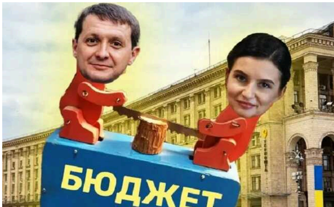
У Нацполіції розслідують діяльність «Київекспертизи» Хорошевського: підозрюють у зловживаннях під час усунення наслідків «прильотів»

КП "Київекспертиза" Хорошевського ймовірно вдвічі-втричі завищувала вартість робіт: до тендерної схеми може бути причетна група столичних чиновників.