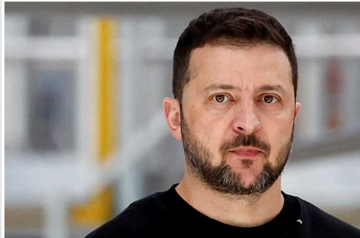
Зеленський розкритикував президента Бразилії за відмову їхати на Саміт миру

Президент України Володимир Зеленський у Сінгапурі також критично відгукнувся про Бразилію, чий президент Лула да Сілва відмовився їхати на саміт до Швейцарії.