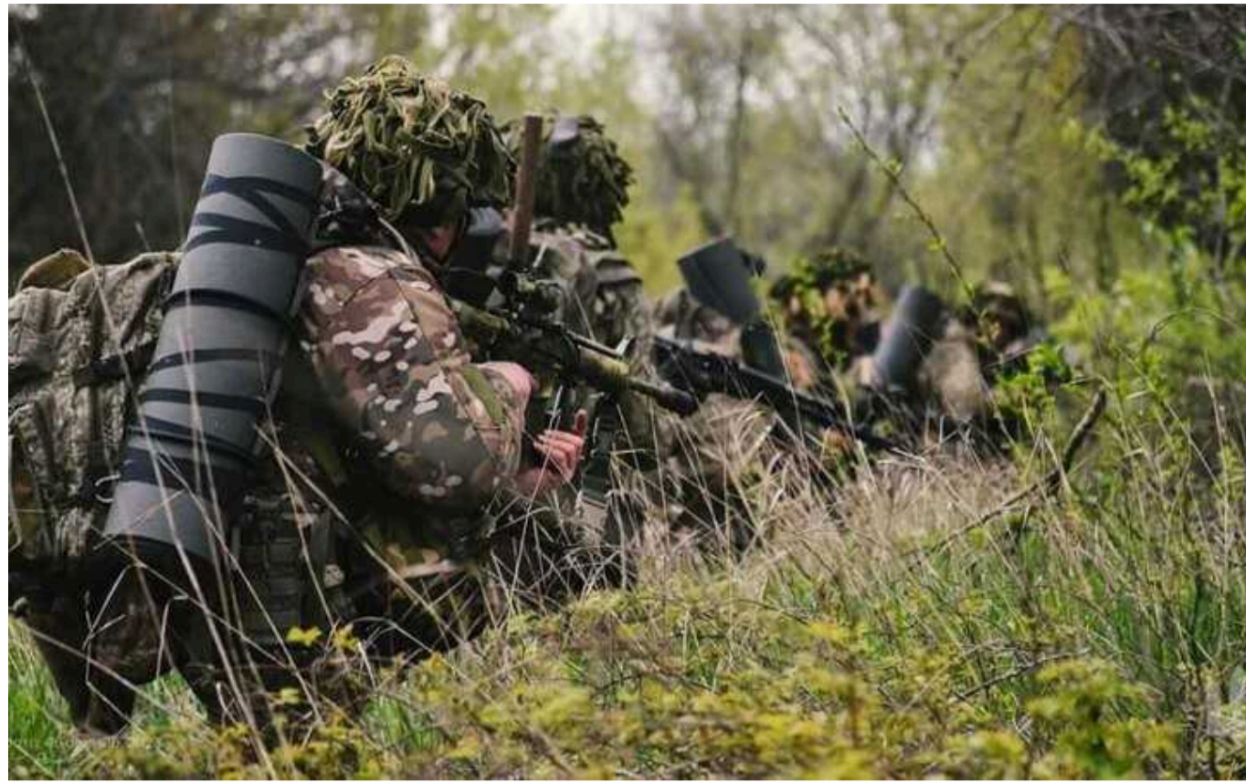
WP: Те, чому навчають в українських навчальних центрах, «повна нісенітниця»

Українські польові командири кажуть, що новоприбулих бійців часто доводиться тижнями навчати базовим навичкам.