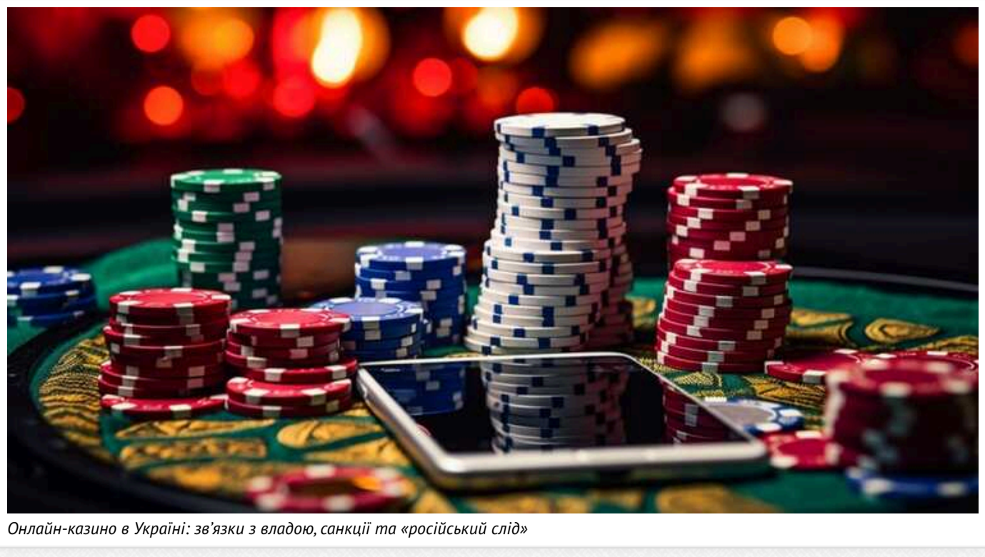
Онлайн-казино в Україні: зв'язки з владою, санкції та російський слід

За минулий рік онлайн-казино в Україні заробили 55,6 млрд грн. Загалом Комісія з регулювання азартних ігор та лотерей (КРАІЛ) з лютого 2021 року до квітня 2024-го видала 23 ліцензії на проведення діяльності з організації та проведення азартних ігор казино у мережі Інтернет.