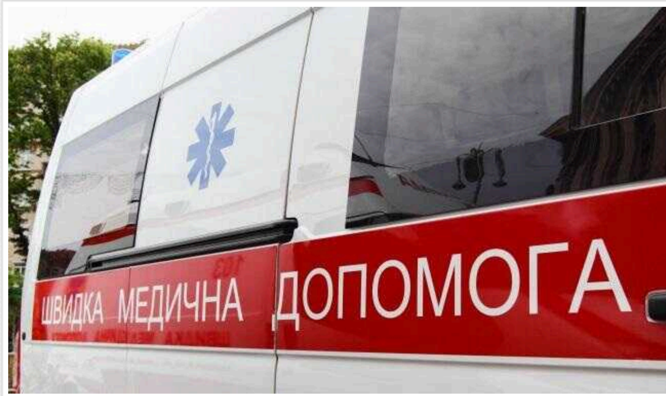
Ракетний удар по Харкову: кількість загиблих зросла

Російські окупанти сьогодні вкотре обстріляли Харків. Унаслідок удару загинули вже 9 людей.