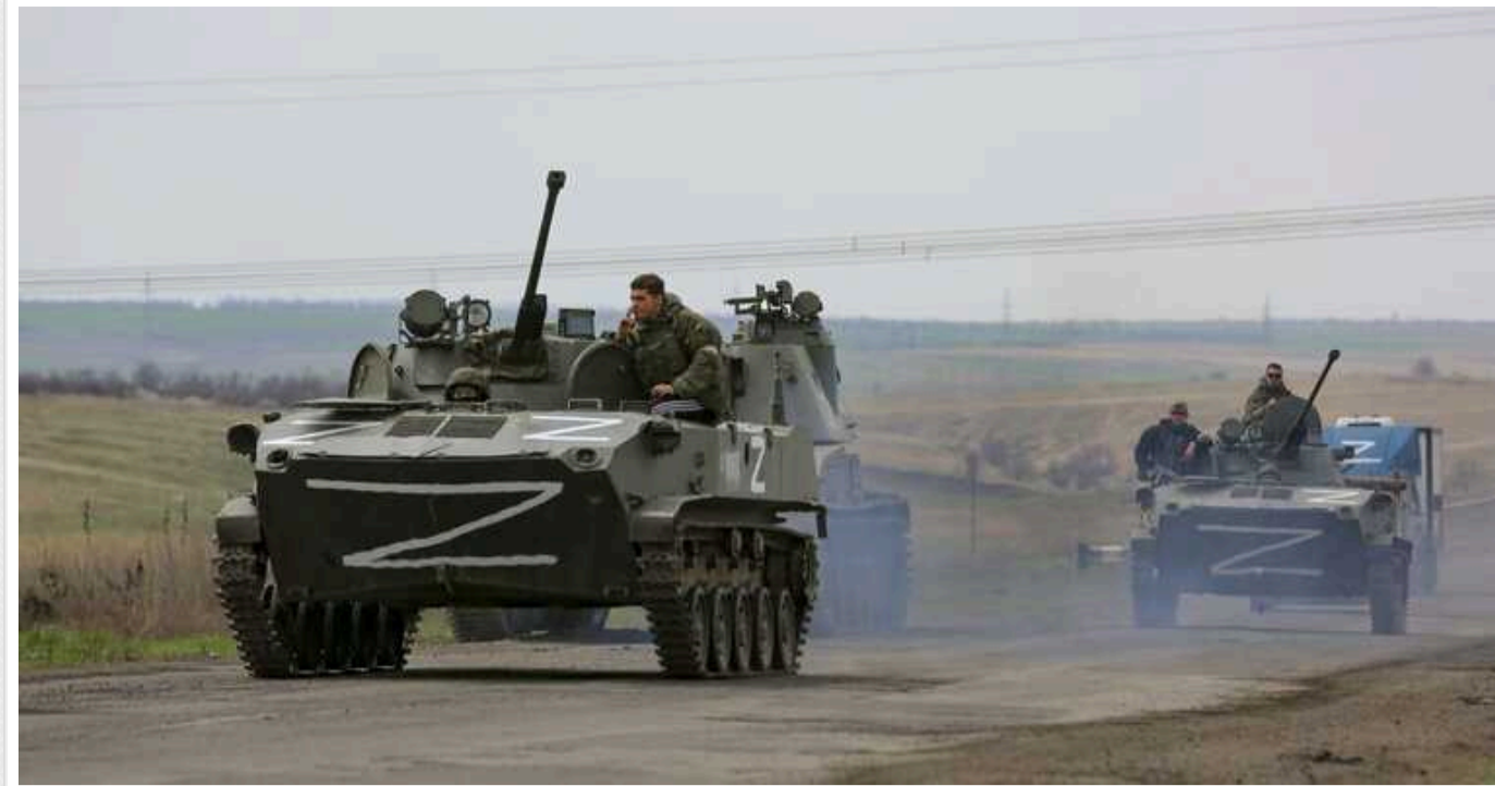
Бліцкриг на Харківщині зупинено, тепер ворог змінив тактику, – військовий

За час, що минув від початку російського наступу на півночі Харківщини 10 травня, українським воїнам вдалося дещо стабілізувати ситуацію. У регіоні продовжуються бої, однак просуватися загарбникам більше не вдається.