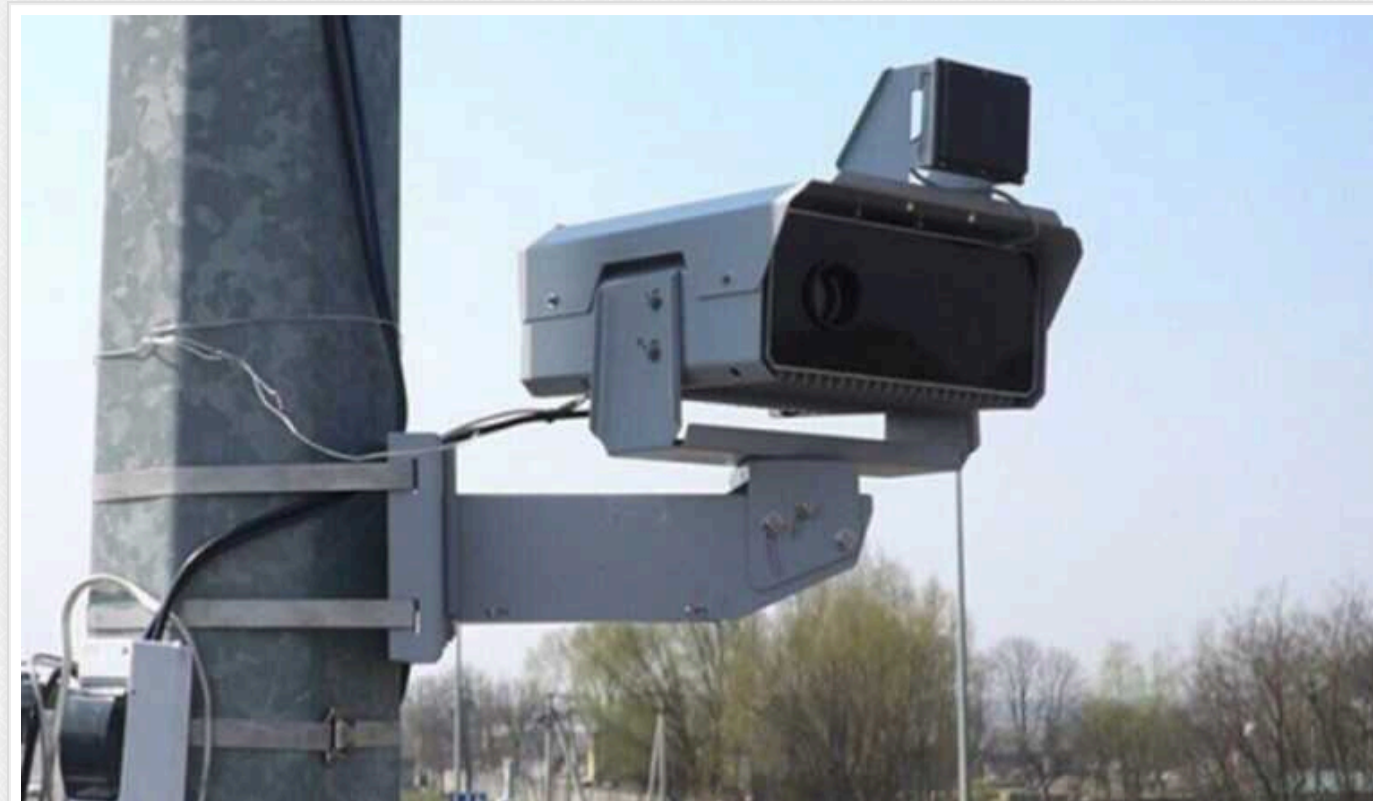
Київські депутати передумали залучати інвестора для стеження за порядком на столичних дорогах

У КМДА зробили чергову спробу залучити приватного інвестора для реалізації проекту "Впровадження системи фіксації порушень у сфері забезпечення безпеки дорожнього руху". Перша така спроба мала місце ще в 2020-ому, але відповідне рішення Київради вже втратило свою чинність через вимоги законодавства. Втім, якщо чотири роки тому керівництво КМДА змогло переконати депутатів у необхідності цих заходів, то наразі воно такими успіхами похвалитися не може. Серед головних причин – народні обранці остерігаються, що записи з вуличних камер можуть потрапити до ворога, а також вказують на те, що МВС пропонує схожу систему на безоплатній основі.