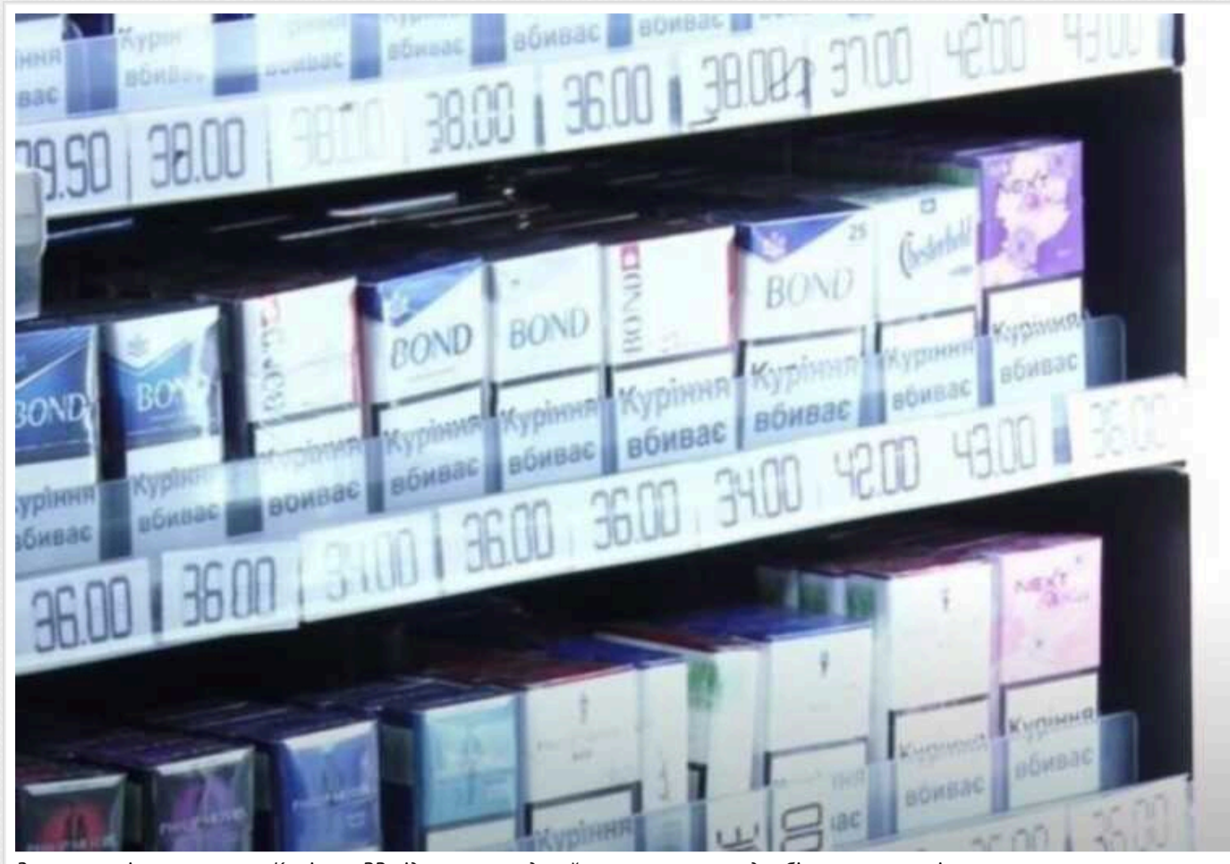
Зростуть ціни на цигарки: Комітет ВР підтримав урядовий законопроект щодо збільшення акцизів

Комітет Верховної Ради з питань фінансів, податкової та митної політики підтримав урядовий законопроект щодо збільшення акцизів на цигарки.