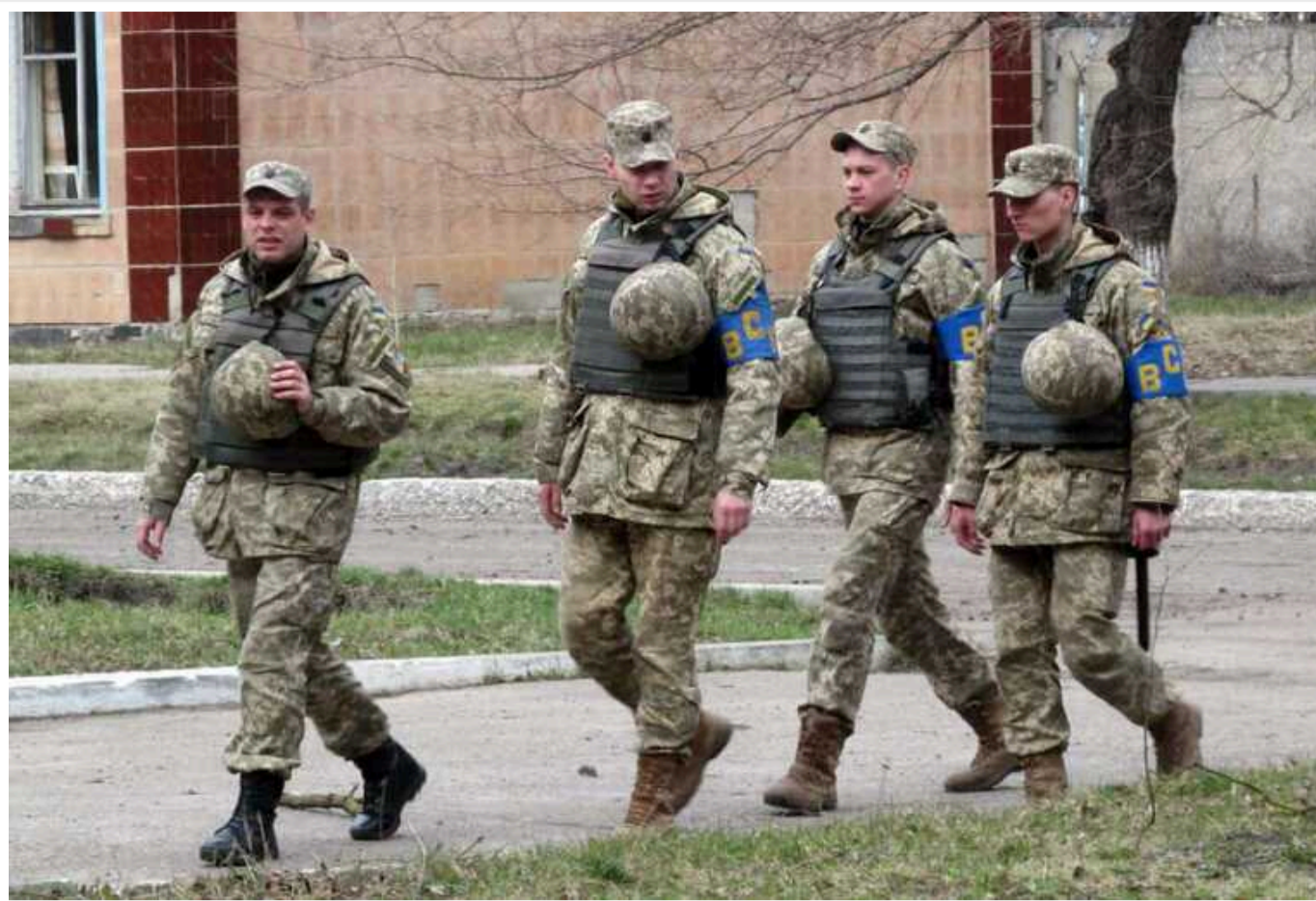
В Україні з'явиться військова поліція: чим займатиметься ця структура

В Україні з'явиться військова поліція – відповідний законопроект зареєструють у ВР найближчим часом. Однак поки що цій структурі не нададуть повноваження повноцінно розслідувати правопорушення в армії.