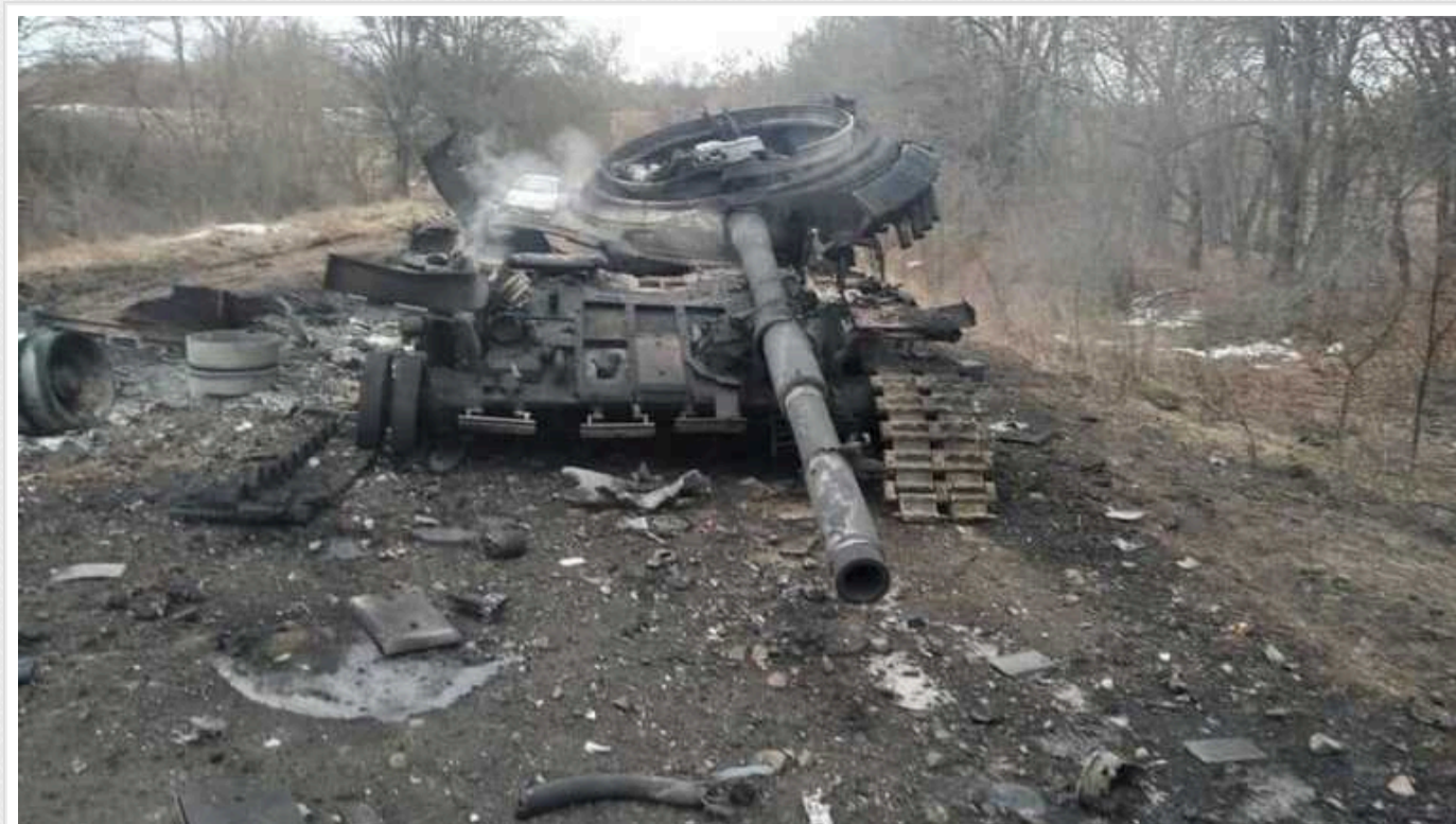
Росіяни влаштували "м'ясний штурм" серед білого дня і поплалися за це

Воїни 58-ї окремої мотопіхотної бригади ім. гетьмана Івана Виговського Збройних сил України показали результати невдалого ворожого "м'ясного штурму", який окупанти влаштували просто посеред білого дня. Противник втратив живу силу та бронетехніку.