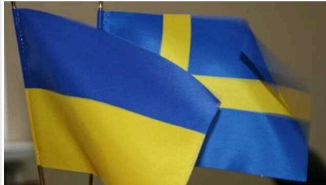
Україна і Швеція підписали угоду про співробітництво у сфері безпеки, – Зеленський

Президент України Володимир Зеленський і прем'єр-міністр Королівства Швеція Ульф Крістерссон у Стокгольмі підписали Угоду про співробітництво у сфері безпеки.