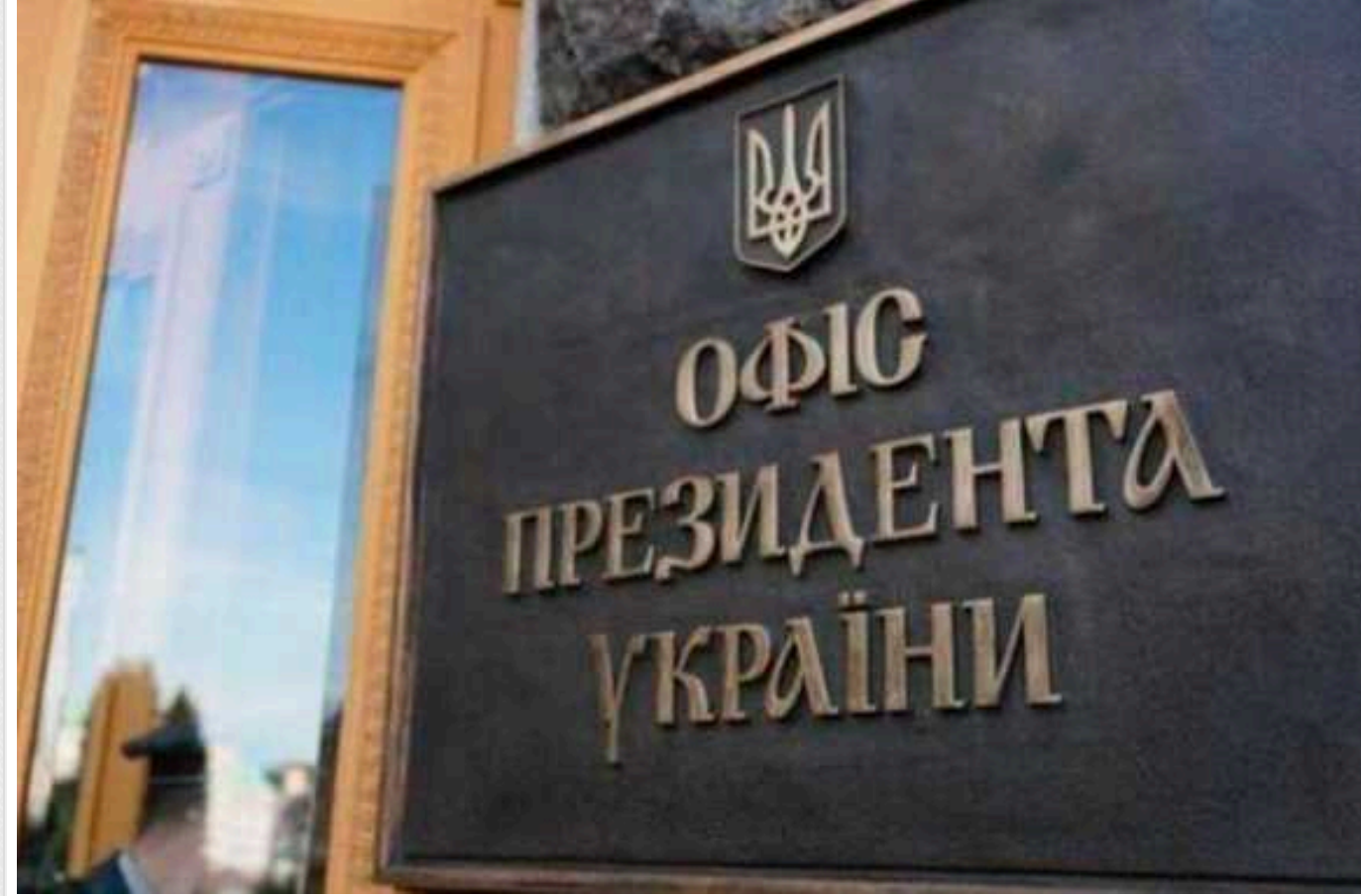
В ОП підтвердили, що США дозволили завдавати ударів по Росії наданою Україні зброєю