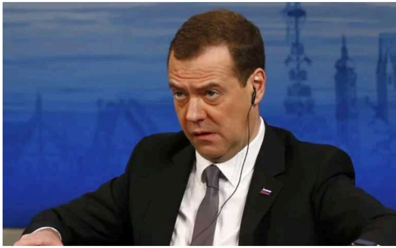
У Росії знову пригрозили ядерним ударом по країнах НАТО, які надають зброю Україні

Колишній президент Росії намагається переконати країни Заходу, що Кремль готовий застосувати ядерну зброю проти України та її союзників. З його слів, члени НАТО вже начебто вступили у конфлікт з РФ.