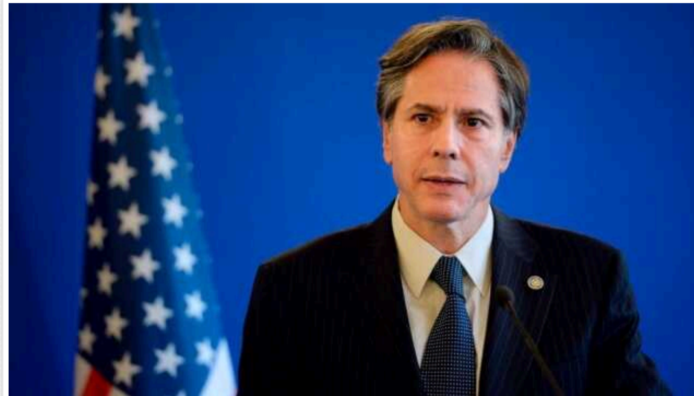
На саміті у Вашингтоні буде надано «дуже потужний пакет» допомоги Україні, – Блінкен

Про це держсекретар США Ентоні Блінкен сказав сьогодні перед початком неформальної зустрічі міністрів закордонних справ НАТО у Празі.