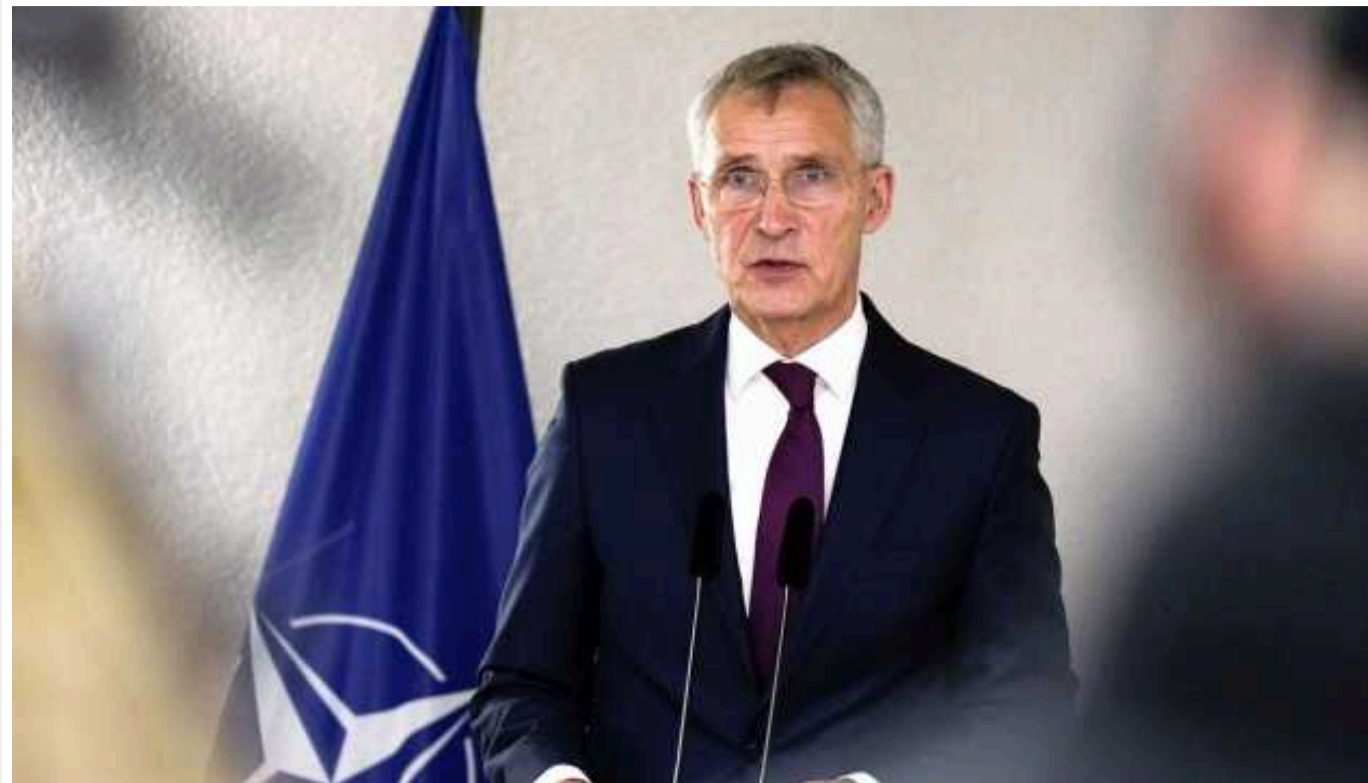
Столтенберг: Спроби РФ змінити кордони у Балтійському морі є неприйнятними

Будь-які спроби Росії в односторонньому порядку змінити кордони та лінії делімітації у Балтійському морі є порушенням міжнародного права та є неприйнятними.