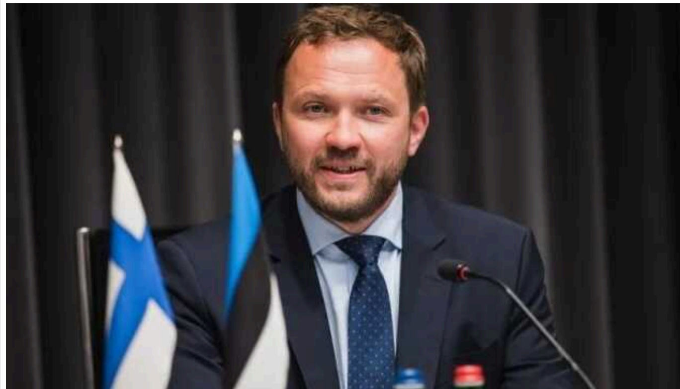
Ми повинні дати Україні свободу захищати себе, – глава МЗС Естонії

Естонія завжди вважала, що Україна має всі законні підстави застосовувати зброю для захисту себе, а також для ударів по військовій інфраструктурі Росії. Вона сподівається, що інші країни-члени НАТО знімуть обмеження щодо можливості України відповідати на агресію Росії.