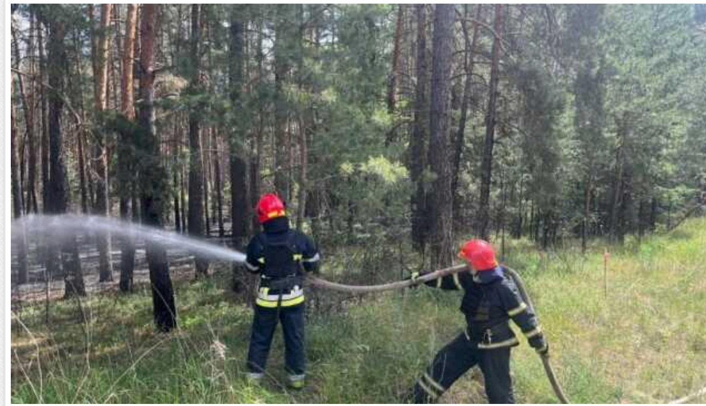
На Харківщині через обстріли окупантів горять вже 3700 гектарів лісу

У Харківській області через бойові дії горять вже 3700 гектарів лісу.