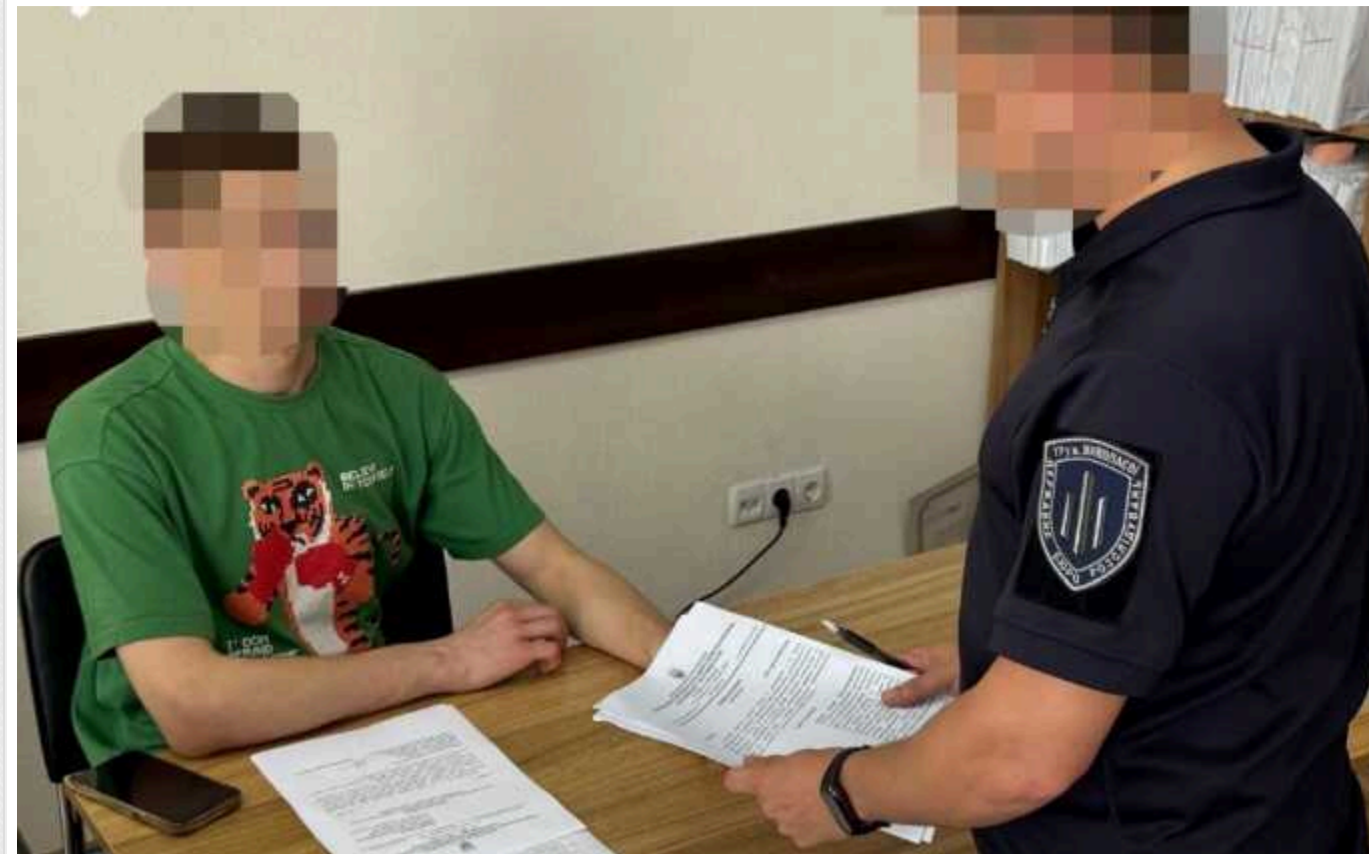
На Одещині бухгалтер військової частини привласнив понад 4 мільйони гривень виплат бійців

На Одещині ДБР повідомило про підозру начальнику фінансово-економічної служби однієї з військових частин, який привласнив 4,2 млн грн, призначених на виплати військовослужбовцям.