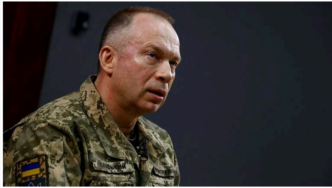
Сирський розповів американському генералу про потреби українського війська

Головнокомандувач Збройних сил України Олександр Сирський поговорив по телефону з головою Об'єднаного комітету начальників штабів США генералом Чарльзом Квінтоном Брауном.