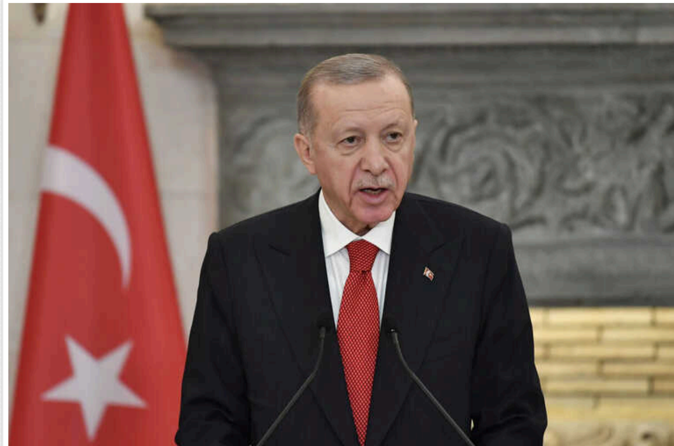
Туреччина погрожує сирійським курдам військовою операцією у разі проведення ними виборів

Туреччина може розпочати військову операцію проти очолюваних курдами угруповань на півночі Сирії, які Анкара звинувачує у зв'язках із забороненими курдськими бойовиками, якщо вони продовжать реалізацію планів проведення місцевих виборів.