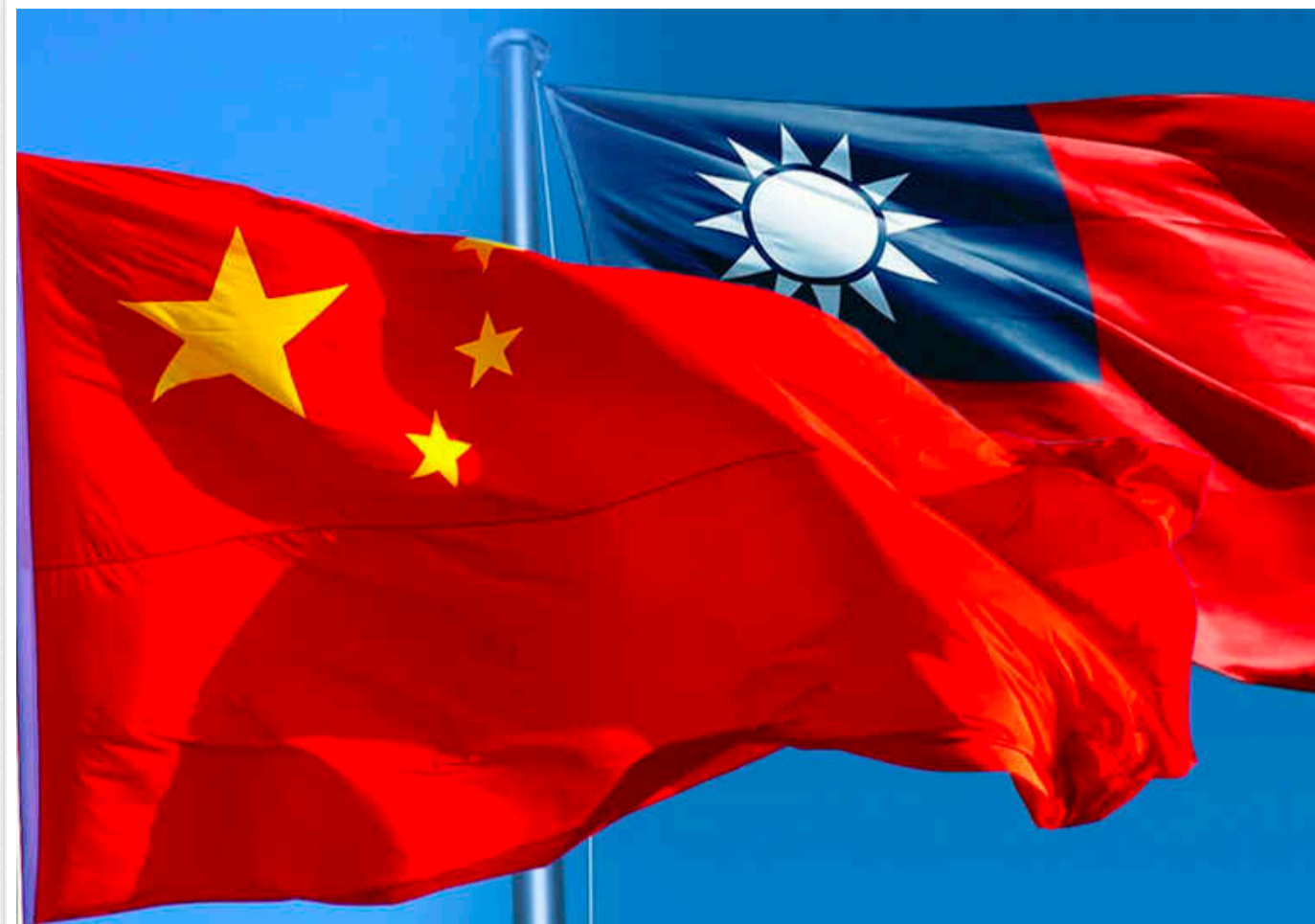
У США висловили занепокоєння КНР щодо її військової активності біля Тайваню

Міністр оборони Сполучених Штатів Ллойд Остін зустрівся у п'ятницю зі своїм китайським колегою Дун Цзюнем в Сінгапурі, щоб обговорити оборонні відносини між США та КНР, а також питання регіональної й глобальної безпеки.