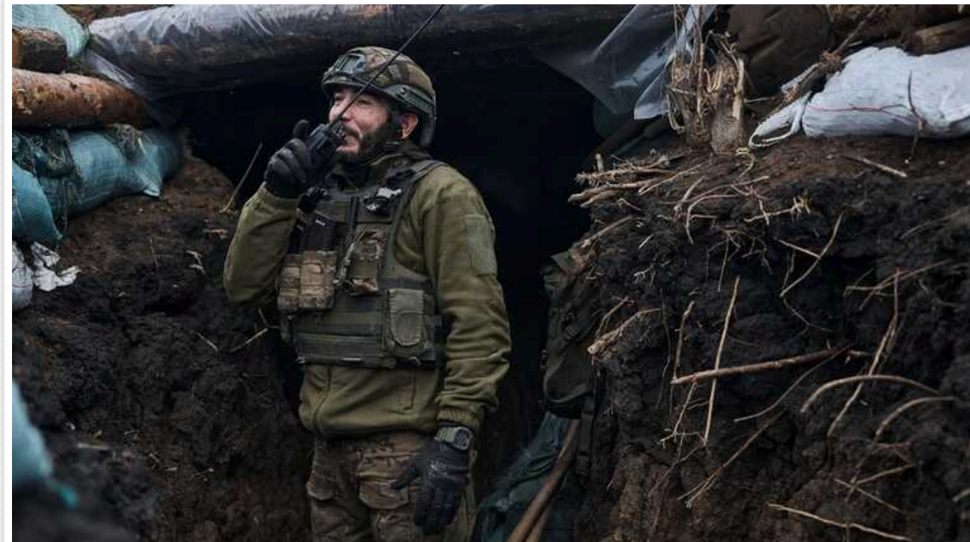
Росіяни готують другу фазу наступу на Харківщині і перекидають підкріплення, – ISW

Підкріплення для російських військових на Харківщині вказує на те, що вони, ймовірно, роблять зусилля із відведення українських сил з критичних ділянок лінії фронту на сході України та створюють "буферну зону" на півночі Харківської області. Таким чином росіяни хочуть розпочати другу фазу свого наступу на Харківщині.