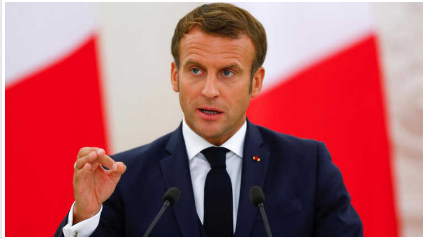
Президент Франції втрутився, щоб переконати прем'єра Канади Трюдо звільнити Airbus від санкцій щодо титану РФ