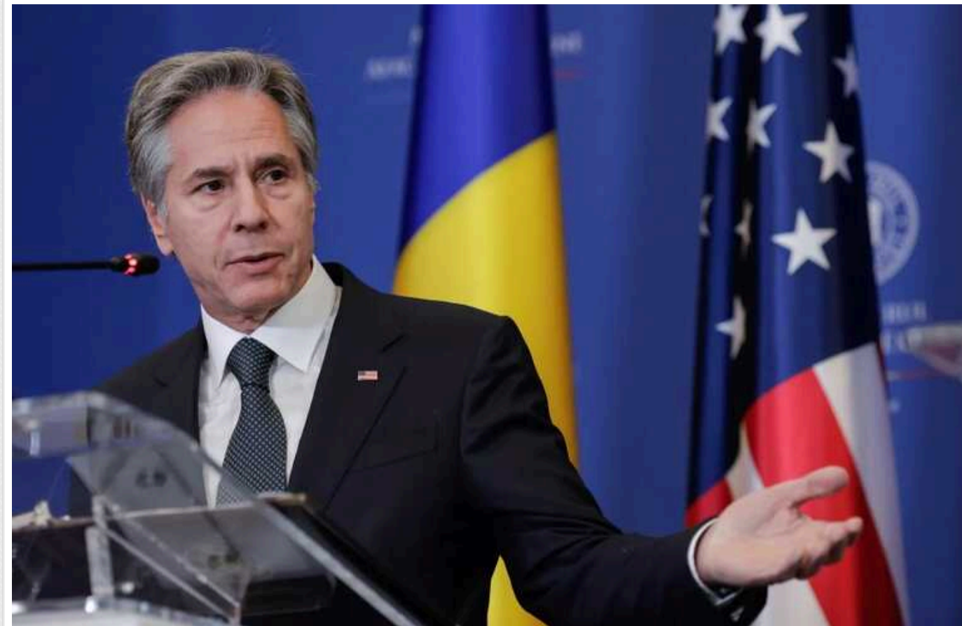
Блінкен: Україна отримає майже мільйон снарядів до кінця року в рамках ініціативи Чехії