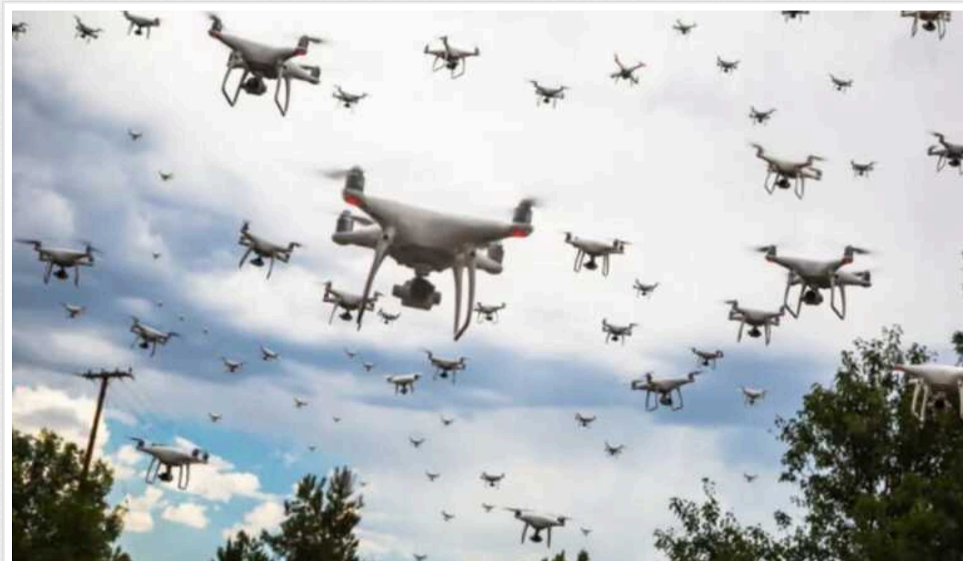
"Стіна дронів" НАТО моніторитиме кордон із Росією за найгіршого зі сценаріїв, – ЗМІ

За словами президента Латвії Едгара Рінкевича, його країна готується до "найгіршого сценарію", зокрема закликає громадян перетворити свої підвали на бомбосховища.