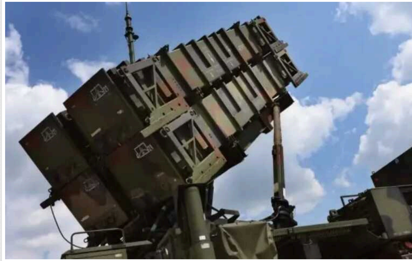
Який результат принесуть удари американськими ППО по цілях у небі над Росією

НАТО вимагає дозволити ЗСУ використовувати всю номенклатуру зброї США, але Росія погрожує ескалацією нового рівня. Якщо не боротися з носіями авіабомб, армія РФ зрівнюватиме із землею українські міста. Опитані аналітики впевнені: російську авіацію треба знищувати на аеродромах.