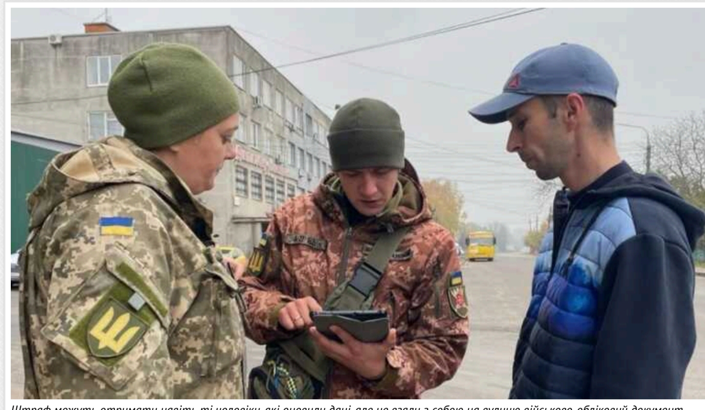
Штраф можуть отримати навіть ті чоловіки, які оновили дані, але не взяли з собою на вулицю військово-обліковий документ