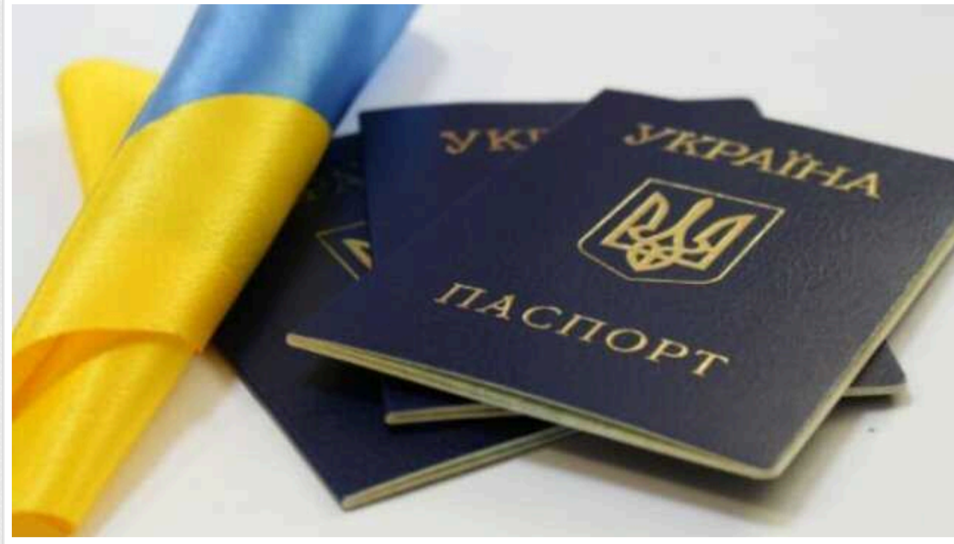
Особи, які хочуть отримати громадянство України, мають скласти іспити з основ Конституції та історії України, – МОН