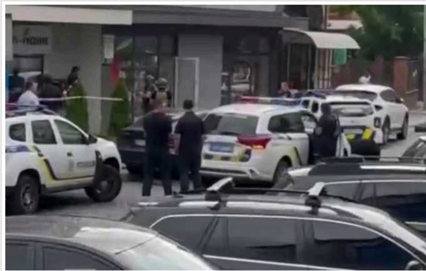
В Ужгороді у приміщенні «Укргазбанку» психічно хворий чоловік повідомив, що у нього із собою вибухівка

Як розповів журналіст Віталій Глагола, "чоловік кричав і повідомив, що у нього в сумці із собою вибухівка".