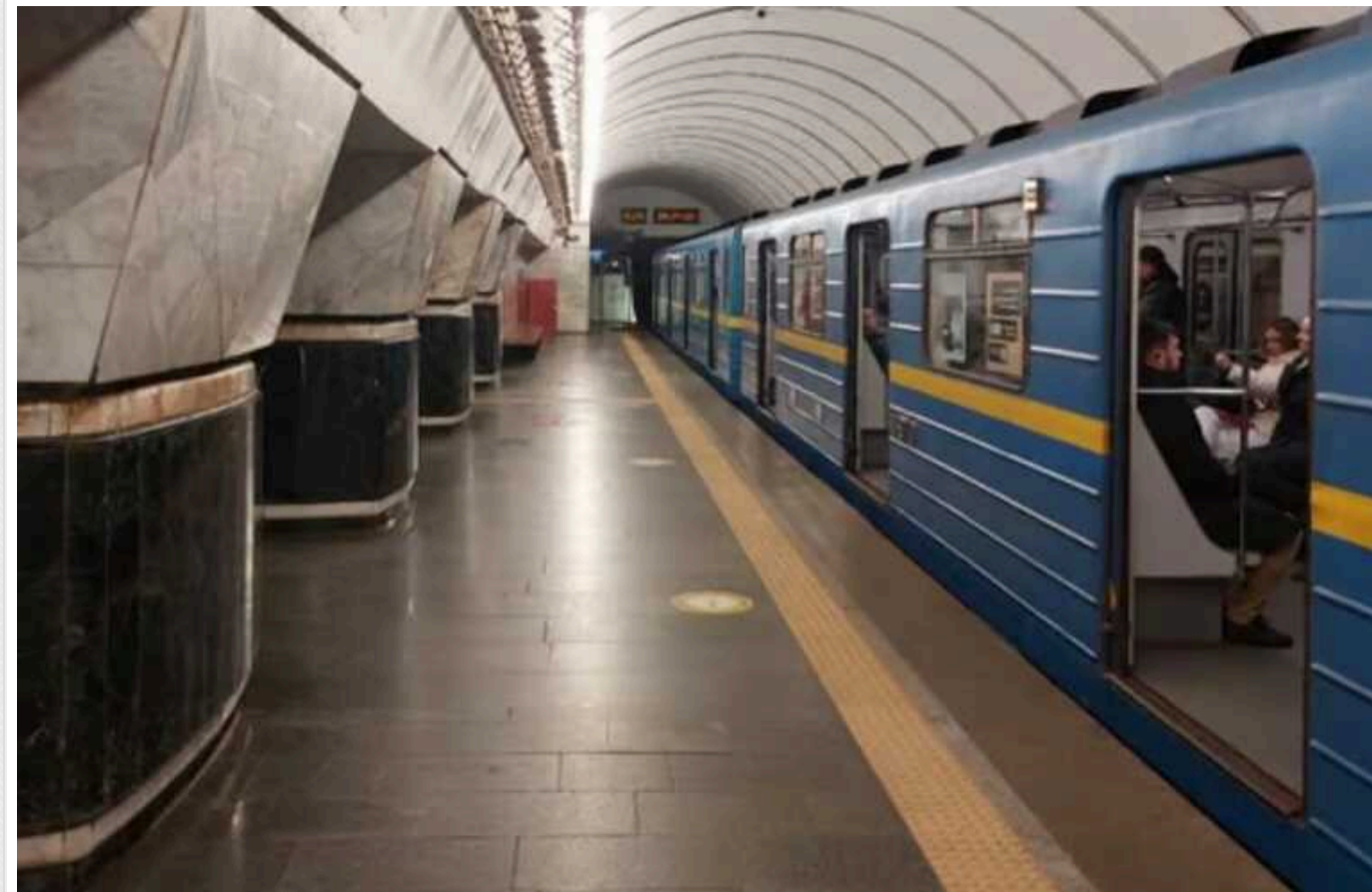
Через дефіцит співробітників у київському метро збільшать інтервали руху поїздів

Людей не вистачає, зокрема, через мобілізацію. У ЗСУ призвали 7% працівників метрополітену.