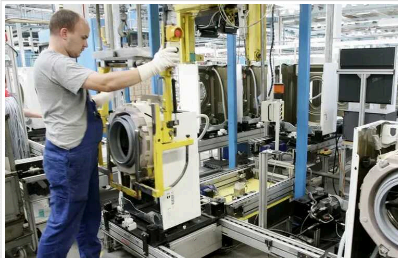
Західні бренди побутової техніки почали продавати в Росію товари, вироблені для України, - росЗМІ

За їхніми даними, відвантаження йдуть через турецькі, польські та прибалтійські структури.