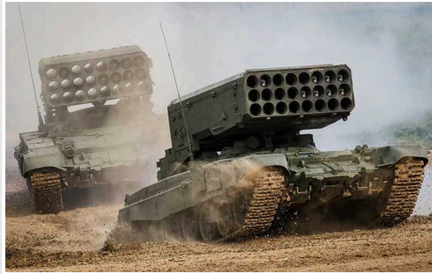
Окупанти почали бити по Вовчанську термобаричними боєприпасами, – речник ОСУВ "Хортиця"

Окупанти вже не вперше використовують важкі вознеметні системи "Сонцельок" по житловій та цивільній інфраструктурі міста.