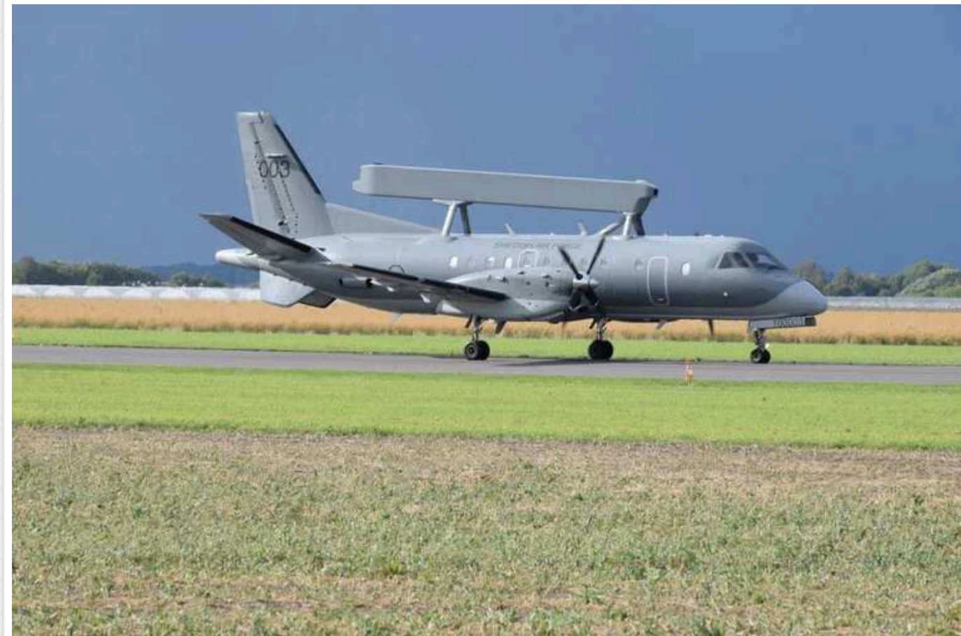
Літаючі радары ACS-890, які Україна отримає від Швеції, зможуть бути інтегровані з F-16

Це значно покращить бойові можливості винищувачів.