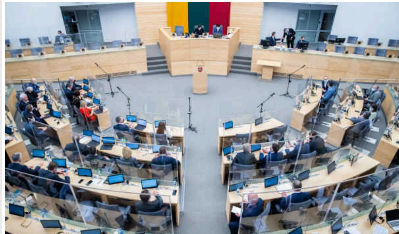
Литва надасть радары для німецької ініціативи з пошуку ППО для України

Уряд Литви в середу схвалив виділення 13,5 млн євро на придбання радарів повітряного спостереження, які будуть передані для коаліції з пошуку засобів протиповітряної оборони України, яку очолює Німеччина.