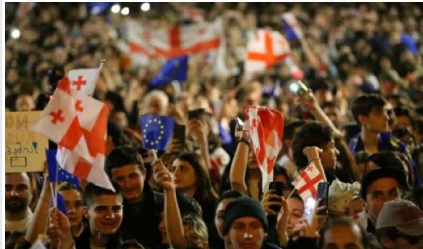
У Грузії неурядові організації заявили про відмову виконувати закон про «іноагентів»

Неурядові організації Грузії заявили, що не будуть виконувати закон про «іноагентів».