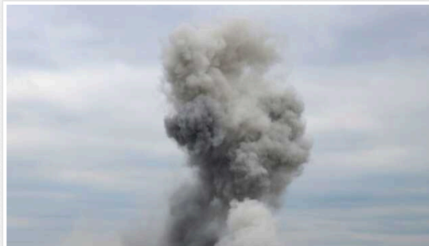
Окупанти завдали ракетного удару по Краснопільській громаді на Сумщині: двоє загиблих і троє поранених

У Сумській області внаслідок російського ракетного удару по Краснопільській громаді загинули двоє людей і ще троє зазнали поранень.