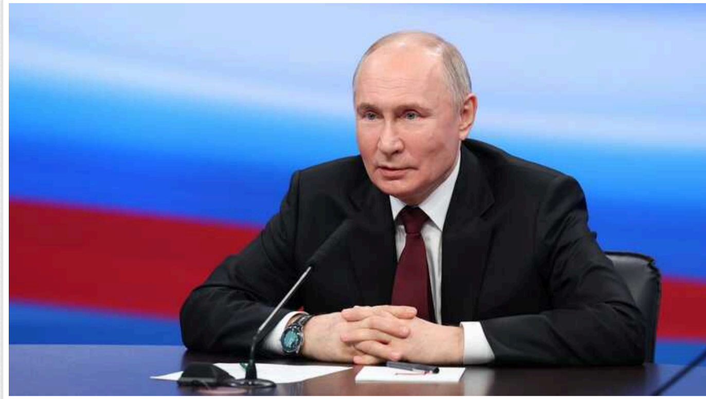
ISW: Заява Путіна про «нелегітимність» Президента України Зеленського була спрямована на іноземну аудиторію

Російські твердження про нібито «нелегітимність» Президента України Володимира Зеленського є відомою інформаційною операцією Кремля, яку той активно просуває протягом останніх тижнів, частково орієнтуючись на іноземну аудиторію.