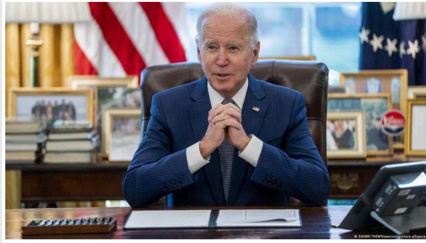
WP: Президент Байден розглядає можливість надати Україні дозвіл бити зброєю США малої дальності по території РФ

Про це заявляє колумніст The Washington Post Девід Ігнатіус.