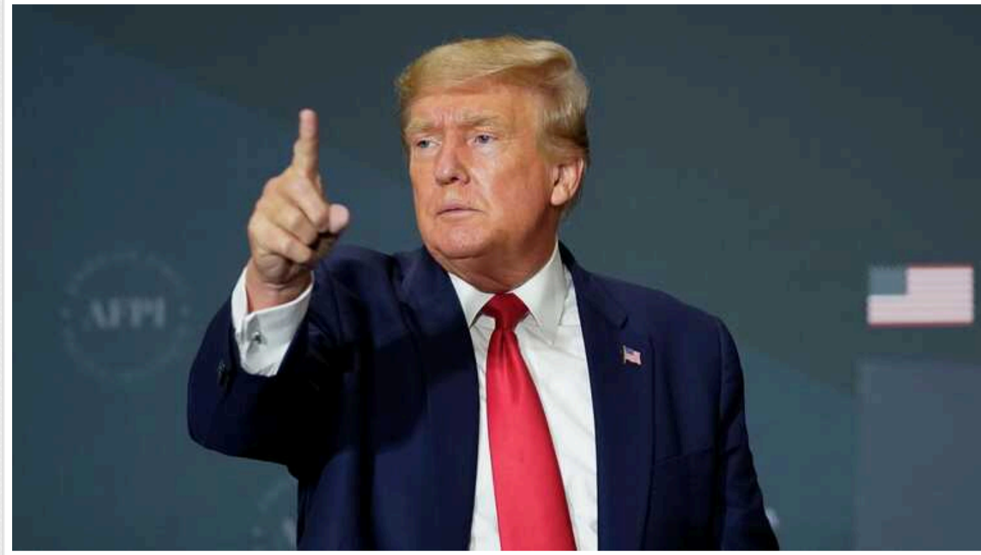
The Washington Post: Трамп заявив, що бомбив би Пекін та Москву

Ця заява Трампа неабияк здивувала "донорів", які фінансують його президентську кампанію.