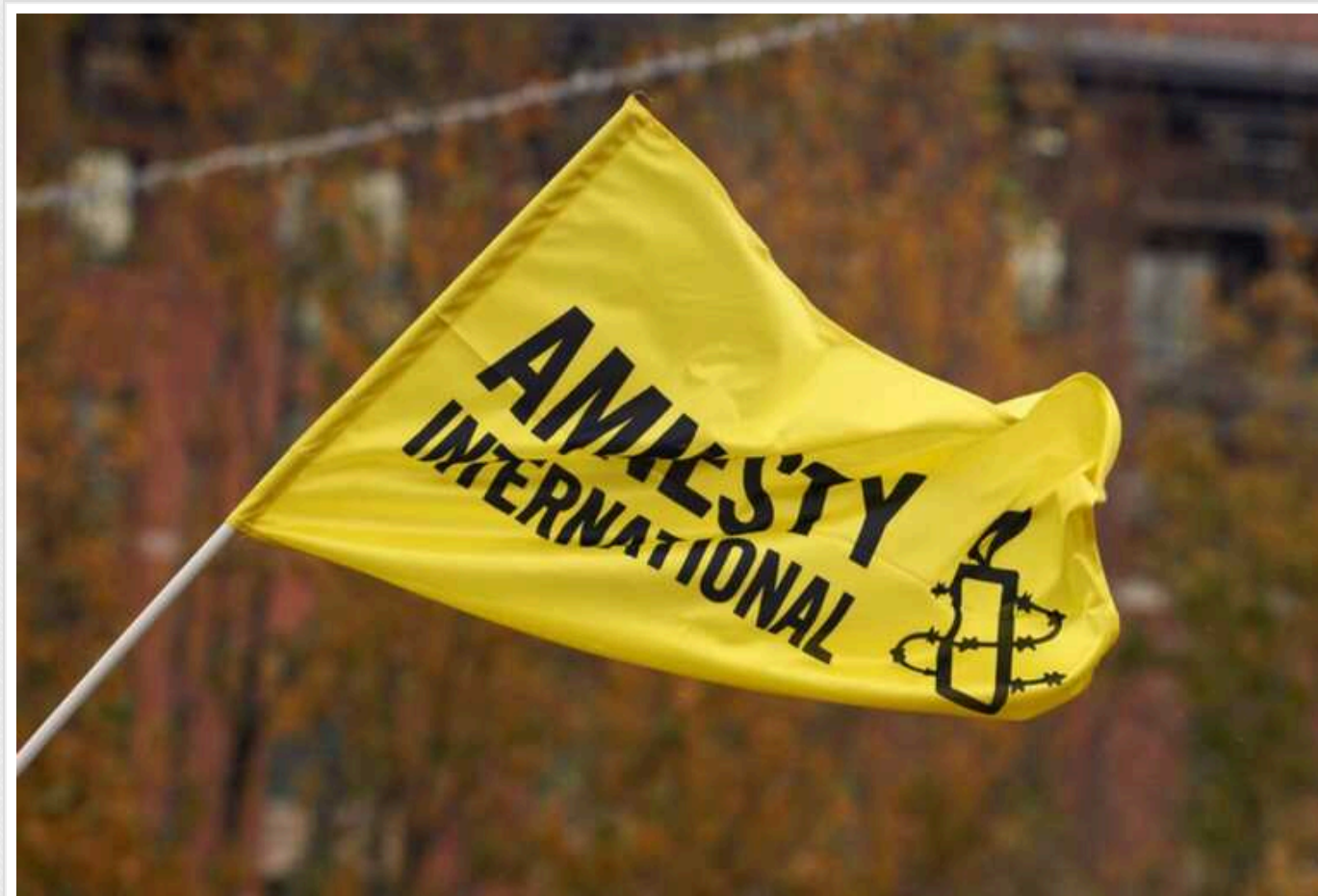
Amnesty International: У світі на третину зросла кількість страт

У 2023 році у світі було проведено 1153 страти, що більш ніж на 30% перевищує показник 2022 року.