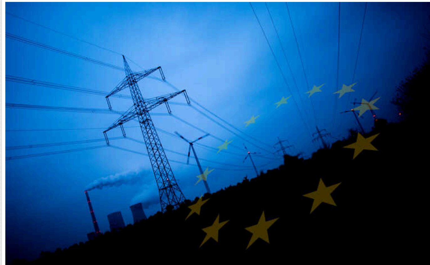
Війна в Україні веде до постійного зростання цін на енергетику та послаблює енергетичну безпеку Європи