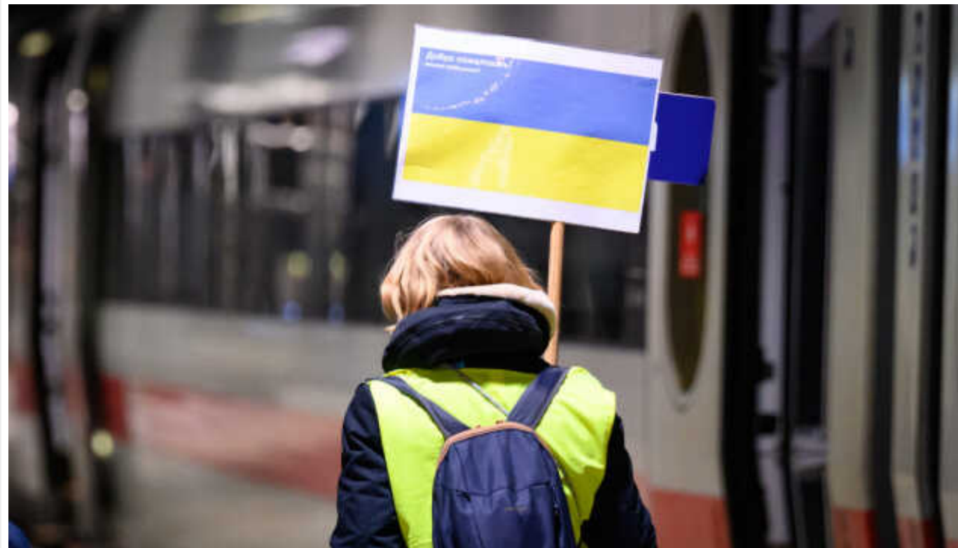
Тисяча українських біженців терміново мають залишити свої будинки у німецькій Саксонії

Видання Tagesspiegel пише, що в середині травня українцям повідомили, що їм доведеться залишити свої будинки через статус українських біженців.