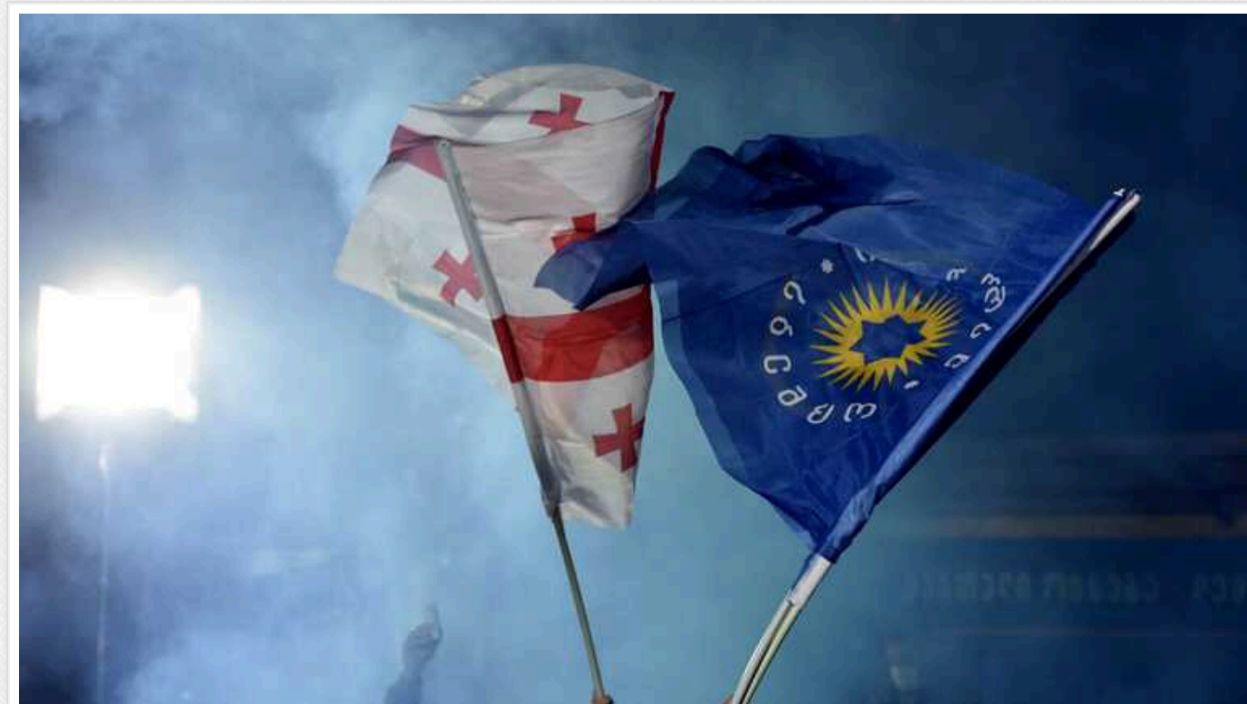
«Грузинська мрія» віддалила країну від шляху вступу в ЄС та НАТО, – Метью Міллер

Державний департамент Сполучених Штатів засудив остаточне ухвалення парламентом Грузії закону про "іноагентів" після того, як керівна партія "Грузинська мрія" подолала вето президента.