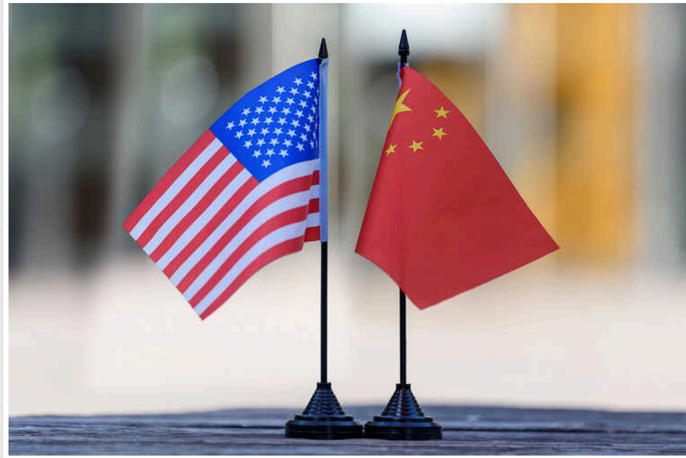
Сполучені Штати готові посилити санкції, щоб припинити китайську допомогу РФ

Сполучені Штати та їхні партнери готові використовувати санкції та експортний контроль, щоб припинити китайсько-російську торгівлю, яка загрожує їхній безпеці на тлі війни проти України, що триває.